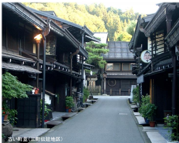
古い町並(三町伝建地区)